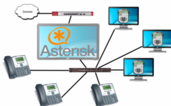
Obr. 2. Topológia VOIP

Taktiež funkčnosť SIP protokolu je dosť závislá na počte routerov pozdĺž cesty, kde sa preukazuje jeho hlavná nevýhoda a to je využitie rôznych portov pre signalizáciu a samotný prenos dát. Pri požiadavke zákazníka alebo inom dôvode zapojenia cez viacero routerov doporučujem použiť IAX protokol, nakoľko v jeho prípade nám Unifikácia signalizácie a zvuku zabezpečuje transparentné prechádzanie NAT-kom a pre použitie IAX protokolu cez firewall je administrátorom potrebné otvoriť jediný port 4569. Aj z tohoto dôvodu klient IAX nepotrebuje vedieť vôbec nič o sieti v ktorej sa nachádza. Z tohoto je jasné, že nemôže nastať situácia, kde sa dokáže spojiť hovor ale bez zvuku.